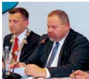
Przewodniczący rady i burmistrz