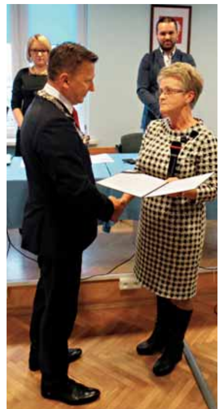
Burmistrz odbiera zaświadczenie i gratulacje