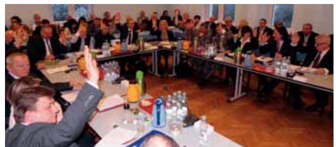
Głosowanie nad porządkiem obrad